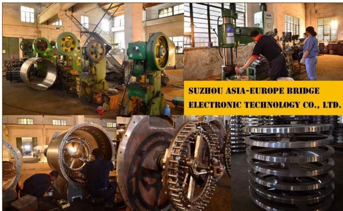
SUZHOU ASIA-EUROPE BRIDGE ELECTRONIC TECHNOLOGY CO., LTD.