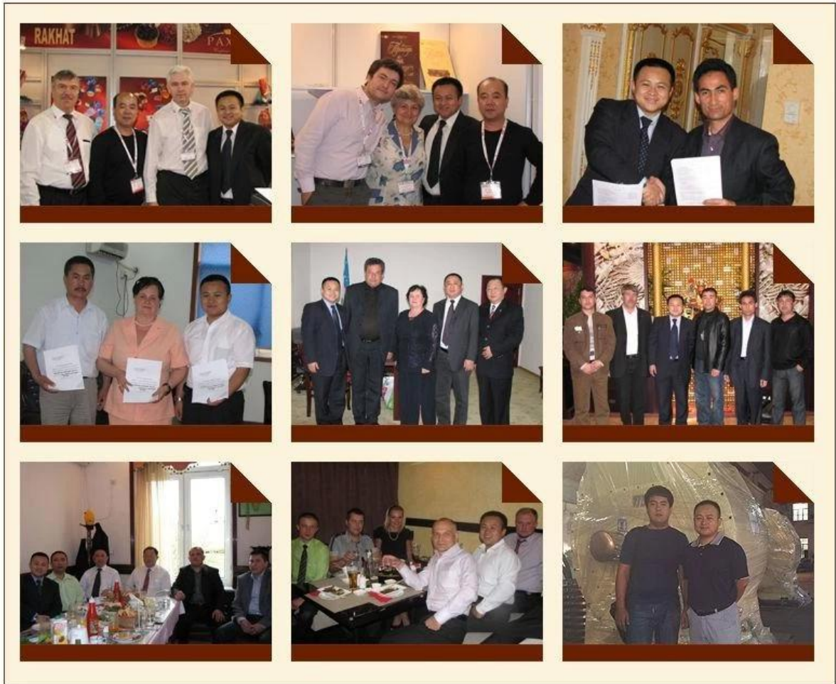
Azienda della macchina della sfera della Cina