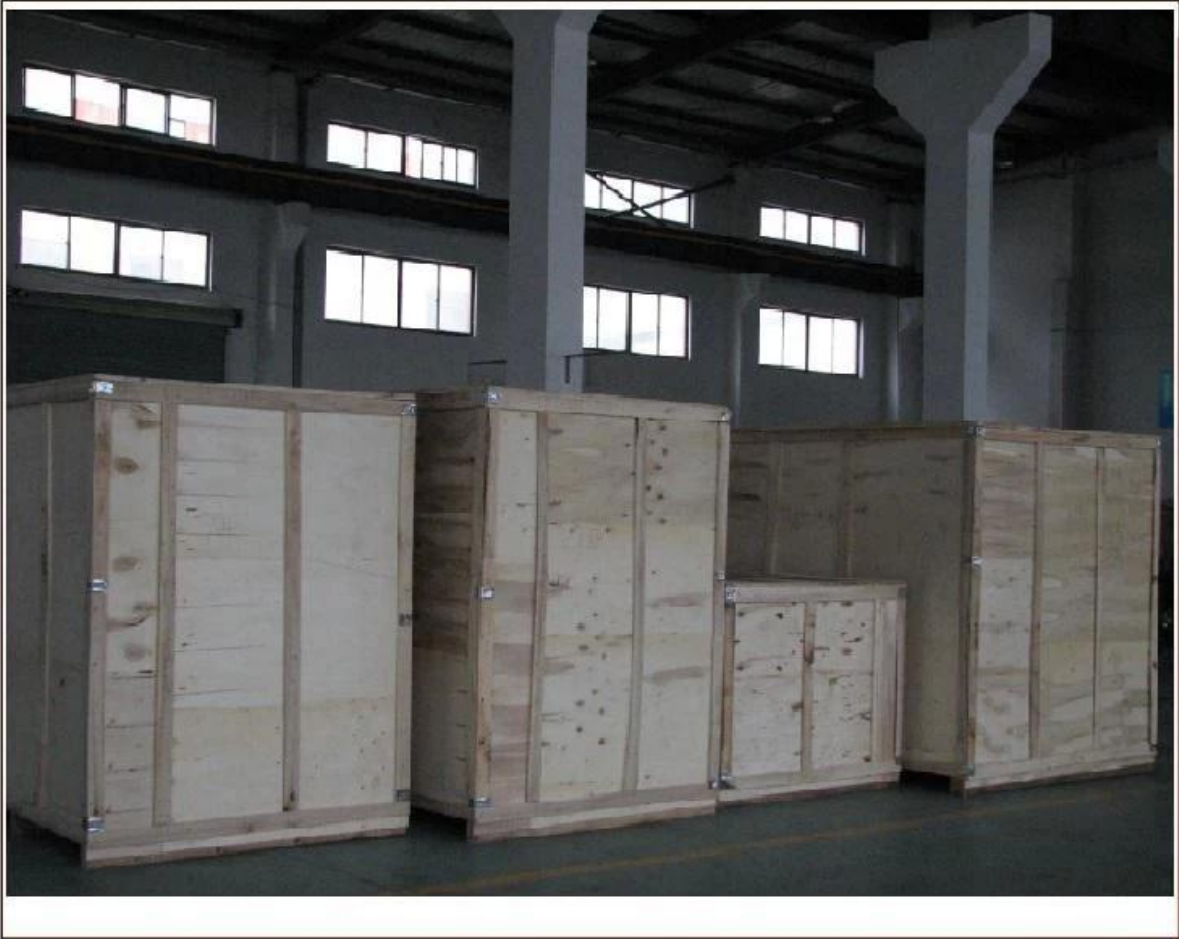
La nostra fabbrica: