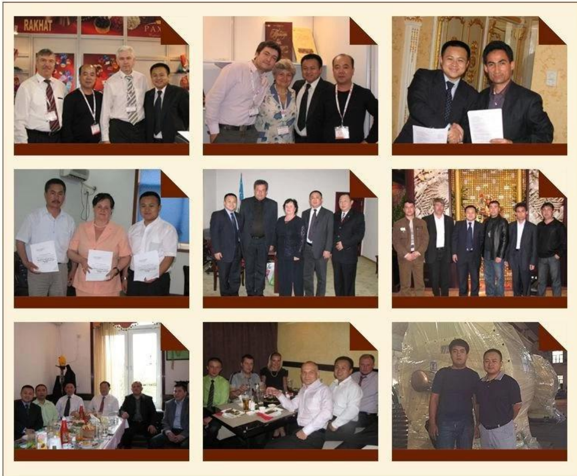
Empresa china de la máquina del molino de bolas