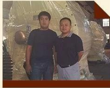
China Kugelmühle Maschine Unternehmen